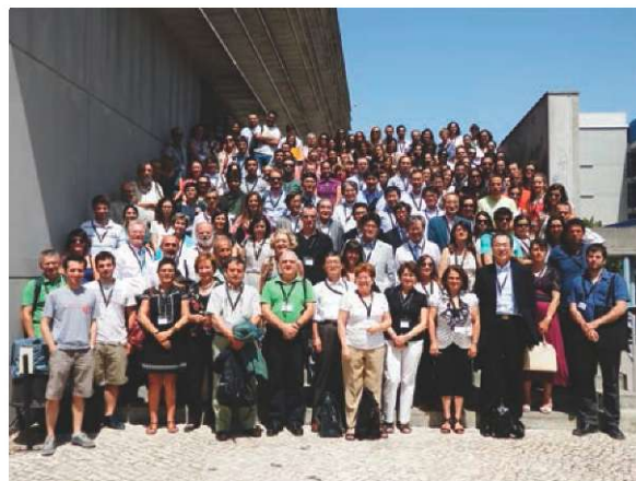
Fotografia de grupo