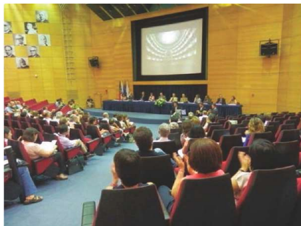
Visão geral do auditório