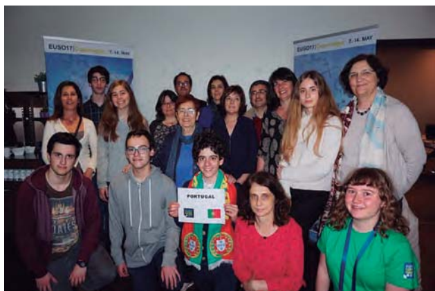
Delegação portuguesa que participou na EUSO 2017, à chegada a Copenhaga.

O resultado conseguido por Portugal na EUSO 2017 constitui um motivo de muito orgulho para todos e deverá ser um reflexo do grande empenho de todos os envolvidos, a que não será alheia a qualidade do ensino ministrado nas Escolas e o esforço adicional na preparação dos estudantes selecionados para a competição.